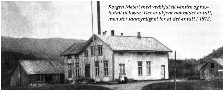
Korgen Meieri med vedskjul til venstre og hestetall til høyre. Det er ukjent når bildet er tatt, men stor sannsynlighet for at det er tatt i 1912.

Korgen meieri framstår som det første store økonomiske foretak hvor så å si hele bygda var involvert og måtte samarbeide. Tross ulike oppfatninger og mange divergerende syn, klarte bøndene i Korgen å samle seg om driften, og om de mange og store utfordringer de etter hvert kom til å stå overfor både under første verdenskrig, i den meget krevende