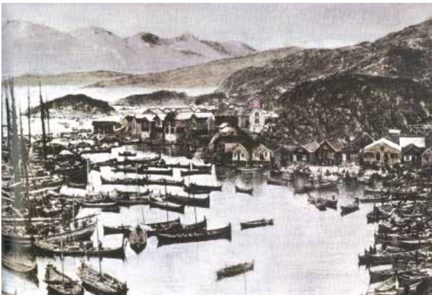
Bergens- handelen var i dette tidsrom- met meget viktig for befolknin-

De geografiske og administrative endringene skjedde også som et resultat av befolknings- og bosettingsutviklingen i landsdelen. Nye boplasser ble ryddet, og indre Helgeland fikk en betydelig befolkningsvekst. Særlig var det et markant fødselsoverskudd på innlandet som også førte til en økning av befolkningen på kysten. Denne befolkningsveksten førte også til en økning i antallet husmannsplasser.